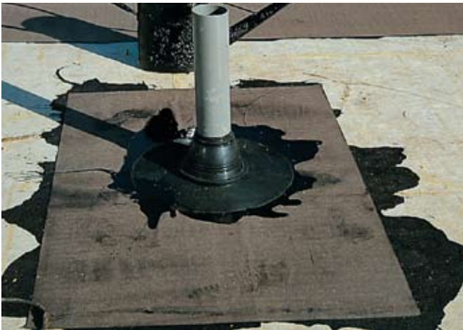
Рис. 3. Установка вентиляционного дефлектора

находящегося под гидроизоляцией. Еще один дефект – протечки конденсата, случающиеся при повреждении пароизоляции во время колебаний наружной температуры около 0°C. Следовательно, в идеальном варианте в конструкции кровли не должно быть мест, где могла бы скапливаться влага. Тем более что с повышением влажности утеплителя повышается его теплопроводность. Таким образом, главным фактором, оказывающим влияние на долговечность и эксплуатационные характеристики кровельных конструкций, является их влажностный режим.