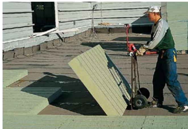
Рис. 2. Укладка теплоизоляционных плит с канавками PAROC ROS30g (ROS40g)

В наружных ограждающих конструкциях, к которым относятся и кровли, материалы крайне редко бывают в абсолютно сухом состоянии. Элементы таких конструкций, если речь не идет о сухом жарком климате, всегда в той или иной степени увлажнены. При этом вода может находиться в материале не только в виде жидкости, но и в виде пара или льда. Естественно, чем выше температура, тем выше вероятность накопления влаги в материале в виде пара. В случае создания теплового подпора за счет работы системы отопления в холодное время года или нагрева верхних слоев кровли солнечными лучами в любое время года давление водяного пара может достигнуть таких критических значений, что может привести к разрушению элементов кровли. Например, на гидроизоляционном битумном кровельном покрытии часто вздуваются пузыри. Причина этого — как раз избыточное давление водяного пара,